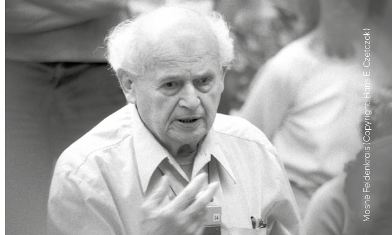
Moshé Feldenkrais